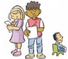
4. JIJ DOET HET ZELF

Binnen het EDI-model geven wij onderwijs op maat. De leerkrachten kijken goed naar hoe de leerlingen zich ontwikkelen en passen de lessen aan. Niet iedere leerling leert immers op hetzelfde tempo. Met extra hulp of moeilijkere stof wordt het onderwijs aangepast aan wat de leerling nodig heeft. De lessen beginnen gezamenlijk, omdat leerlingen ook van elkaar kunnen leren. Daarna gaan ze zelf aan het werk met hun eigen opdrachten.