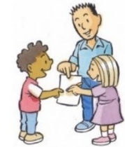
2. WIJ DOEN HET SAMEN