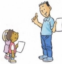
1. IK DOE HET VOOR